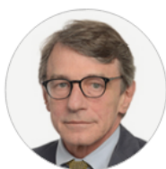
Председател David-Maria SASSOLI

Евродепутатите избраха Давид Сасоли (С&Д, Италия) за председател на Европейския парламент с 345 гласа от 667 валидни бюлетини, във втори тур.